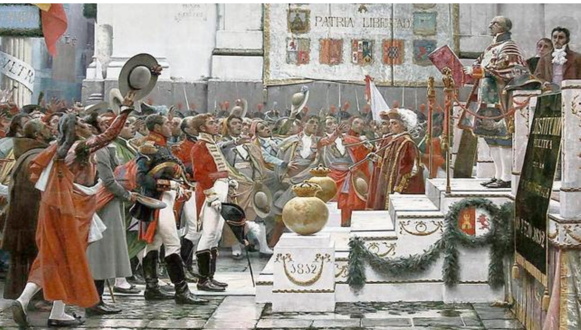
Proclamación de las Cortes de Cádiz . Salvador Vinegra.