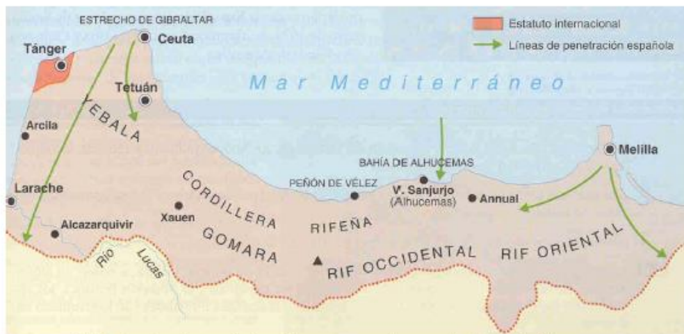
El Protectorado español en Marruecos en tiempos de Primo de Rivera.

FUENTE HISTÓRICA: Relacione el mapa que se reproduce con la Guerra de Marruecos.