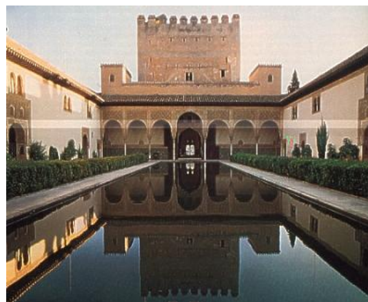
Patio de los Arrayanes (Torre de Comares, al fondo).