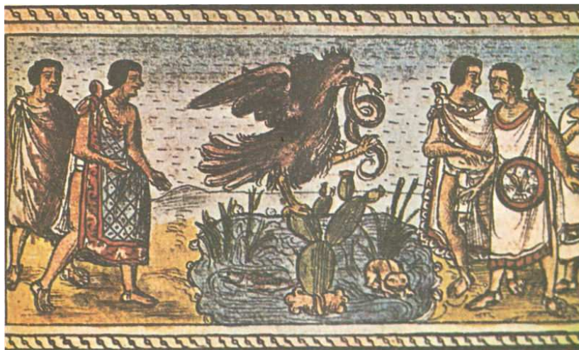
Códice Durán, S. XVI